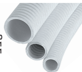
I2913500 I2913511 I2913501

Avec spirale en PVC dur intégrée pour éviter l'écrasement. Très résistants.