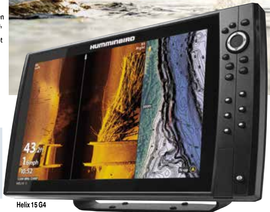
Helix 15 G4