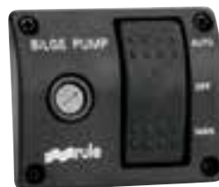
Automatischer Schalter 3 Positionen: Automatic, Manual und Off. Mit Kontrolllampe und Sicherung. Automatische Rückstellung von Manual auf Off. Masse: 75 x 61 mm