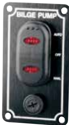
Kippschalter für Bilgenpumpe 12 V Funktionen: Automatic, Manual und Off. Mit Kontrolllampe. Automatische Rückstellung von Position Manual auf Off. Abmessungen: 90 x 50 mm