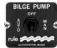
Automatischer Schalter 3 Positionen: Automatic, Manual, Off. 12 und 24 V. Masse: 57 x 50 mm