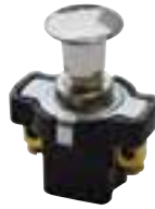
Schubschalter aus Messing, 2-polig, (On/Off) Max. 10 A, Schaft 8 mm, für Wand max. 3 mm