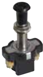
Schubschalter aus Messing, 2-polig, (On/Off) Max. 10 A, Schaft 8 mm, für Wand max. 15 mm