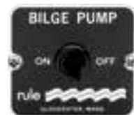
Manueller Schalter 2 Positionen: On/ Off. 12 und 24 V. Masse: 57 x 50 mm