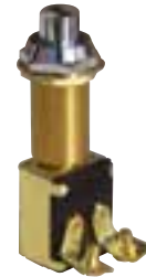
Druckschalter Aus verchromtem Messing, für Wand max. 25 mm. Loch Ø 16 mm