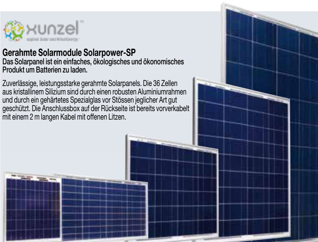
DP0015 DP0030 DP0060 DP0080 DP0120

Zuverlässige, leistungsstarke gerahmte Solarpanels. Die 36 Zellen aus kristallinem Silizium sind durch einen robusten Aluminiumrahmen und durch ein gehärtetes Spezialglas vor Stößen jeglicher Art gut geschützt. Die Anschlussbox auf der Rückseite ist bereits verkabelt mit einem 2 m langem Kabel mit offenen Litzen.