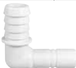
Schlauchanschluss 19 mm abgewinkelt, 2 Stücke