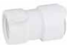
Adapter 1/2" BSP Innen-gewinde, 2 Stücke