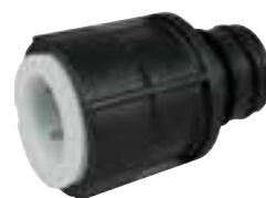
Adapter für Jabsco Pumpen 2 Stücke