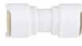
Gerade Verbindung 2 Stücke