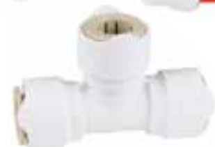
T-Verbindung 2 Stücke