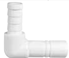
Schlauchanschluss 13 mm abgewinkelt, 2 Stücke