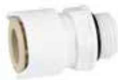
Adapter 3/8" BSP Aussen-gewinde, 2 Stücke