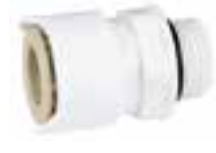
Adapter 1/2" BSP Aussen-gewinde