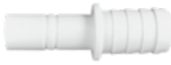
Schlauchanschluss 19 mm 2 Stücke