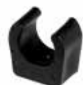
Montage Clip 10 Stücke