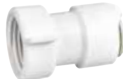
Adapter 3/4" BSP Innen-gewinde, 2 Stücke