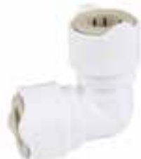
Winkelverbindung 2 Stücke