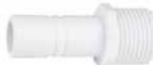
Adapter 1/2" BSP Aussen-gewinde, 2 Stücke