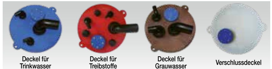
Deckel für Trinkwasser