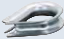
Kauschen aus verzinktem Stahl, offen