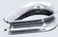
Kauschen aus rostfreiem Stahl, offen