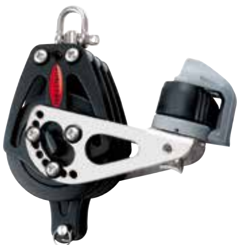
Dreifach mit Bügel und Schotklemme Blockierbarer Wirbelschäkel*