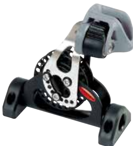
Einfache Blöcke, schwenkbar mit Schotklemme