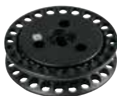
Rolle mit Rätzsche aus Aluminium