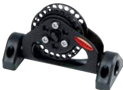
Einfache Blöcke, schwenkbar