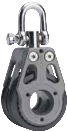
Doppelt Blockierbarer Wirbelschäkel*