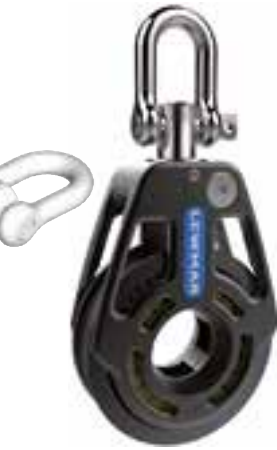
High Load einfach Blockierbarer Wirbelschäkel*