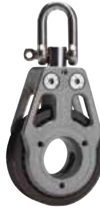
Einfach Blockierbarer Wirbelschäkel*