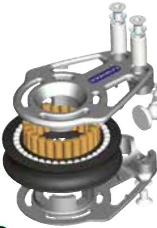
HL High Load Block Serie 80 Torlonadellager und doppeltes Delrin-Kugellager