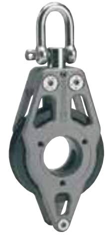
Einfach mit Bügel Blockierbarer Wirbelschäkel*