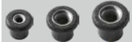
RF181PNP RF183PNP RF256PNP