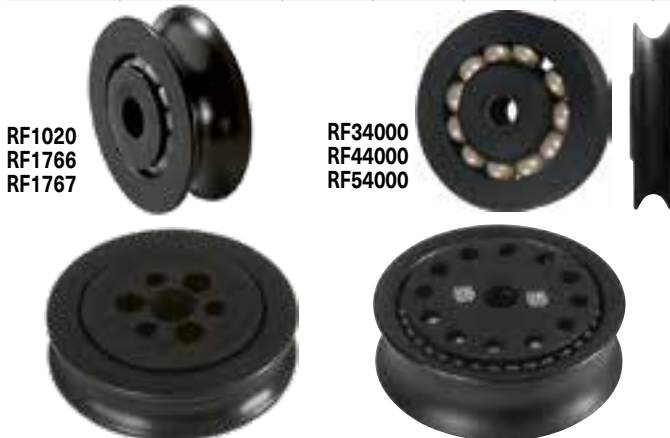
RF1020 RF1766 RF1767