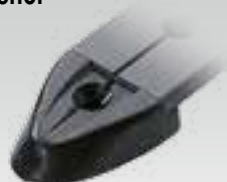
Endstück aus Nylon Für Schiene RC7251