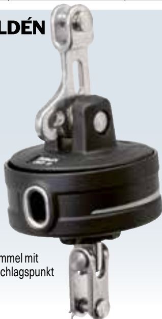
Trommel mit Anschlagpunkt