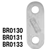
BR0130 BR0131 BR0133