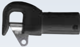
Spibaum-Beschlag Ø Rohr: innen 22 mm