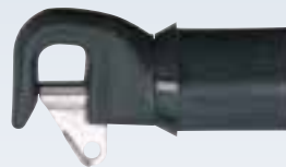
Spibaum-Beschlag Ø Rohr: innen 29 mm