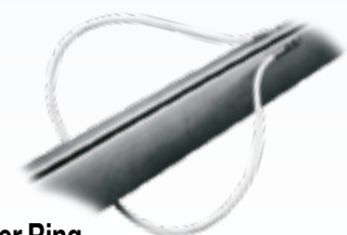
Flexibler Ring Zur Lagerung des Spibaums entlang des Grossbaums