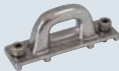
Breite 25 mm