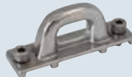
Breite 32 mm