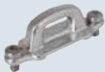
Breite 19 mm