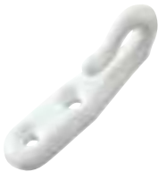
Haken aus Nylon Länge 52 mm, Löcher Ø 4 mm