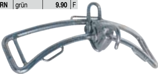
Platte mit auslösbarem Trapezhaken Aus rostfreiem Stahl