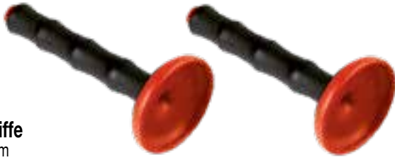
Trapezgriffe Ø Loch 7 mm