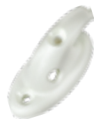
Haken aus Nylon für Sandow Ø 5mm Löcher Ø 4 mm