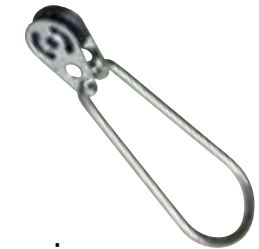
Trapezring Mit Rolle zur Höheneinstellung Aus rostfreiem Stahl