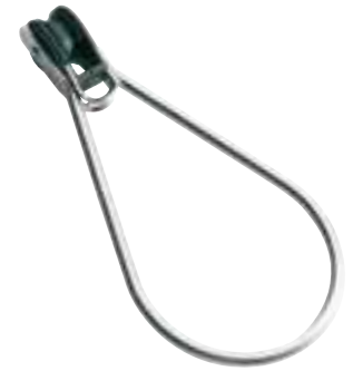
Trapezring Auf Kugellager zur Höheneinstellung. Aus rostfreiem Stahl