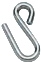
RF048A RF049 RF050