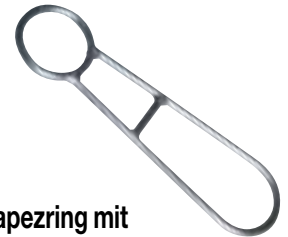
Trapezring mit 2 Positionen Aus rostfreiem Stahl