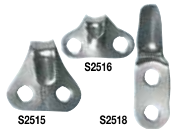
Reffhaken gebogen Aus rostfreiem Flachstahl