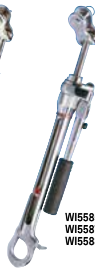
WI5585 WI5587 WI5588