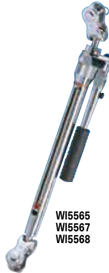
WI5565 WI5567 WI5568