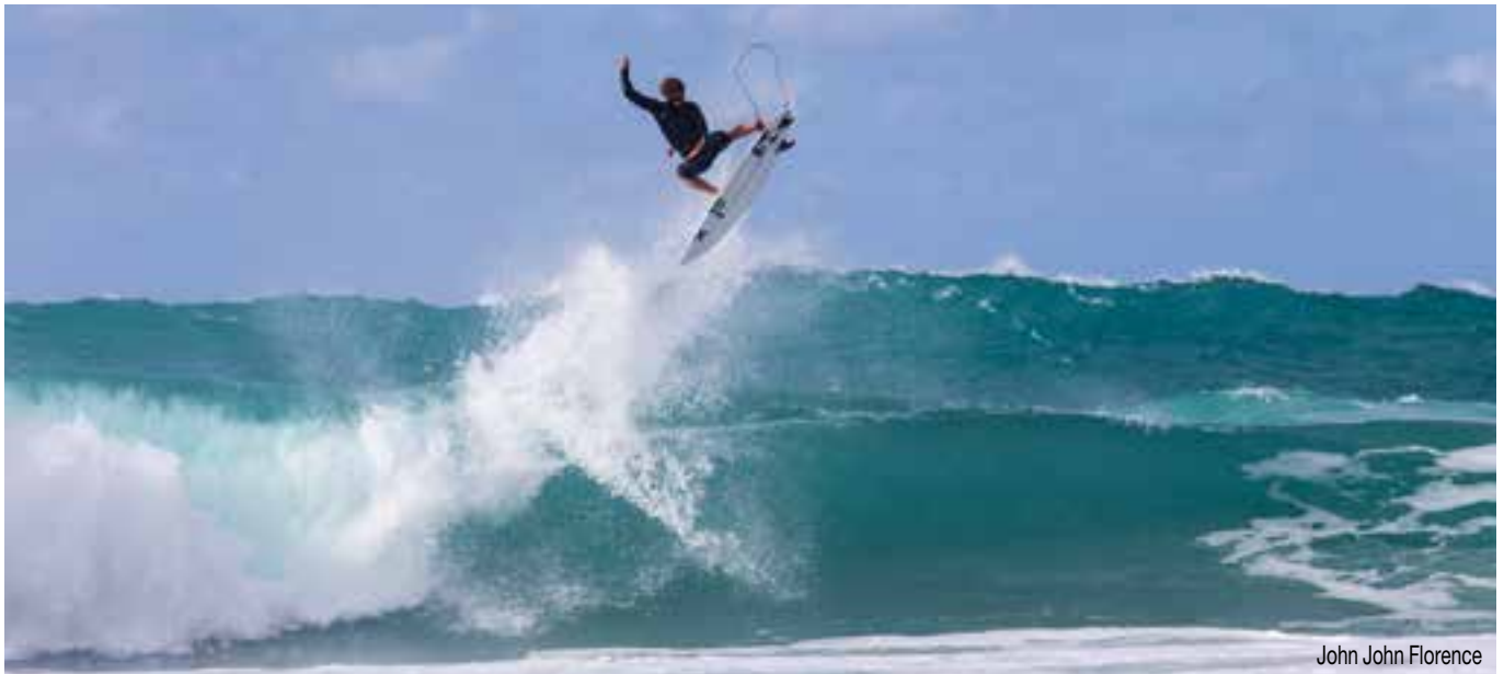
John John Florence