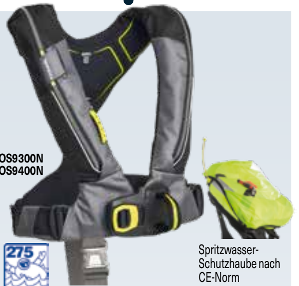
Spritzwasser-Schutzhaube nach CE-Norm