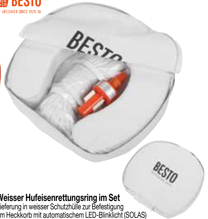
Weisser Hufeisenrettungsring im Set Lieferung in weisser Schutzhülle zur Befestigung am Heckkorb mit automatischem LED-Blinklicht (SOLAS) und schwimmender Leine von 30 m Länge.