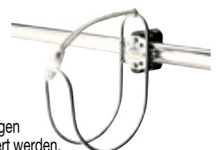
Halterung für Rettungsring Aus rostfreiem Stahl. Rettungsring kann gegen eine Schottwand oder am Heckkorb montiert werden.