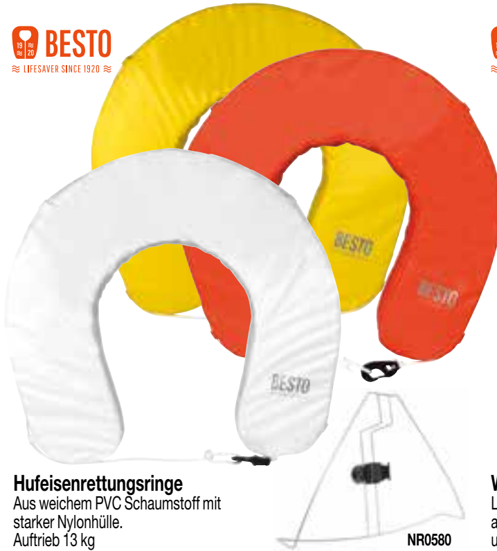
Hufeisenrettungsringe Aus weichem PVC Schaumstoff mit starker Nylonhülle. Auftrieb 13 kg