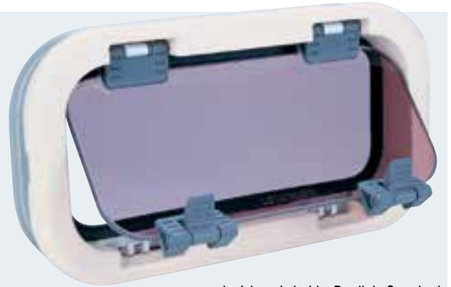
Intérieur du hublot Portlight Standard