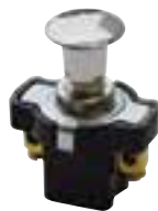
Interrupteur à tirette à 2 pôles (On/Off) Max. 10 A, tige 8 mm, pour paroi max. 3 mm