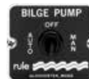
Interrupteur de commande automatique 3 positions : Automatic, Manual et Off. 12 et 24 V. Dimensions : 57 x 50 mm