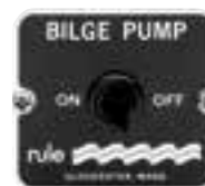
Interrupteur de commande manuel 2 positions : On/Off. 12 et 24 V. Dimensions : 57 x 50 mm