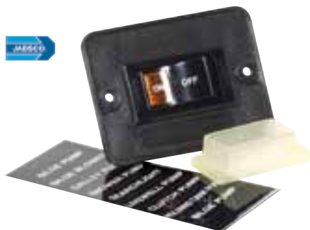
Interrupteur Master Switch Fonctionnement On/Off pour les pompes de cale à 12 ou 24 volts. Il est fourni avec 7 étiquettes pour différentes applications. Dimensions : 70 x 54 mm