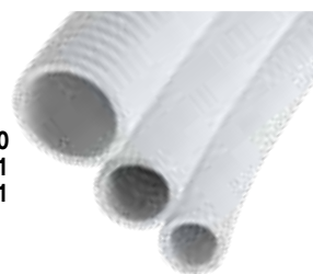
I2913500 I2913511 I2913501

Avec spirale en PVC dur intégrée pour éviter l'écrasement. Très résistants.