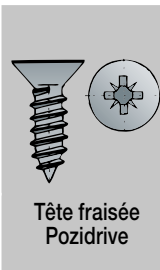
Tête fraisée Pozidrive