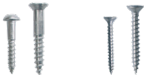
Vis à bois