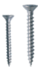
Vis à panneaux