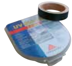
Bande de protection UV

A coller à l'extérieur sur les verres acryliques. Largeur 25 mm, longueur 10 m