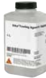
Sika Tooling Agent N

Pour le lissage des joints Sikaflex. pH neutre, n'agresse pas la peau et n'empêche pas l'adhérence des peintures. Le Sika Tooling Agent N est appliqué sur les joints de Sikaflex avant qu'ils n'aient formé leur peau.