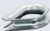
Cosses en acier galvanisé, ouvertes