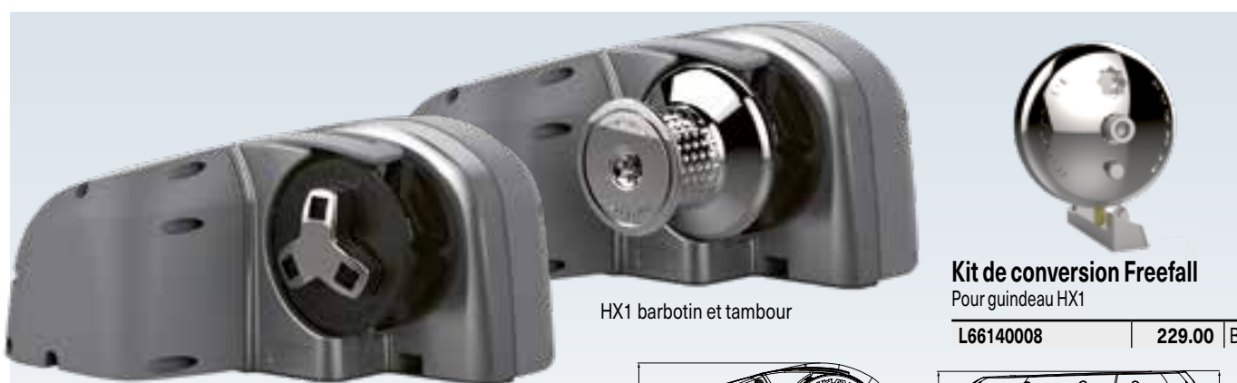
HX1 barbotin seul