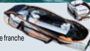
Travel Bag TQ1925-00