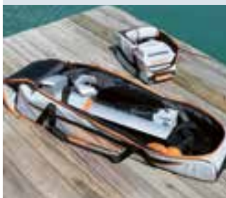
Travel Bag TQ1925-00

Les moteurs Travel 603 et 1103C ont été complètement retravaillés et ils sont 10% plus puissants que les modèles Travel 1003 et 503. Nouveau design et moteur plus silencieux que le prédécesseur, support pour la chaise moteur amélioré.