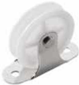
Poulie simple, debout