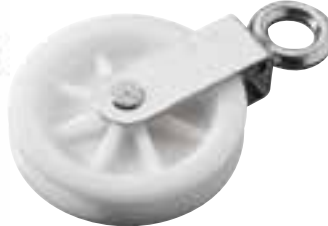
Poulie simple, œil sur émerillon