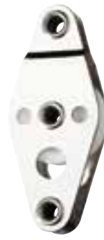
Poulie simple à ringot