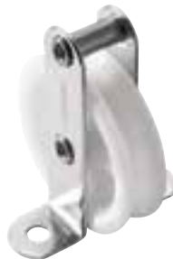
Poulie simple, debout avec ringot