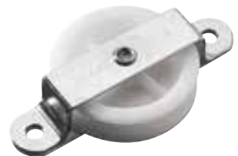
Poulie simple, plat pont émerillon