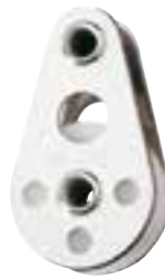
Poulie simple, applique