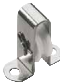
Poulie simple, debout, axe amovible