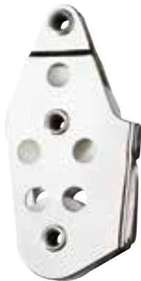
Poulie violon, coinçeur à sifflet