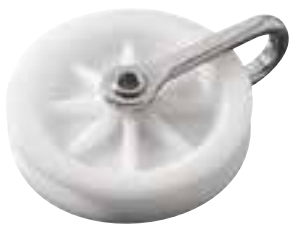
Poulie simple, boucle