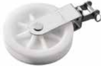
Poulie simple, manille sur émerillon