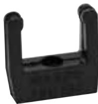
S2340 S2384 S2386