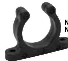
NR8440 à NR8481