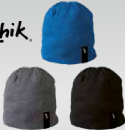
Bonnets En fibre acrylique, intérieur en micro fourrure. Taille unique