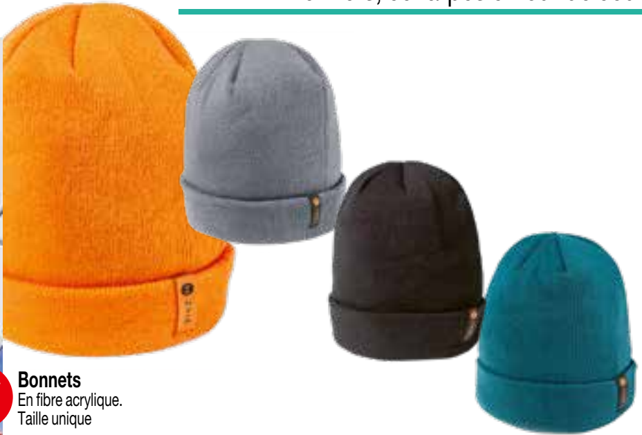
Bonnets En fibre acrylique. Taille unique