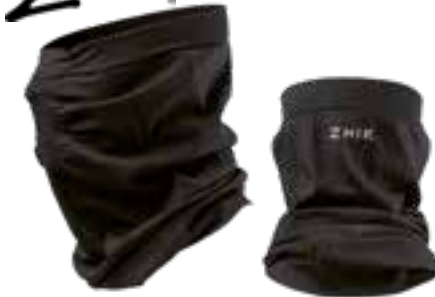
Echarpe tube En tissu polyester et élasthanne, perforé pour une circulation d'air accrue autour de la bouche et du nez. Taille unique