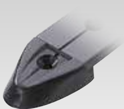
Embout en nylon Pour rail RC7251