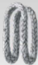
Boucle en Dyneema