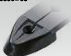
Embout en nylon Pour rail RC7251