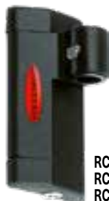
RC26166 RC26366 RC26466