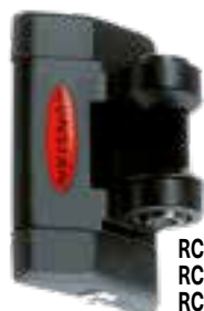
RC26163 RC26363 RC26463