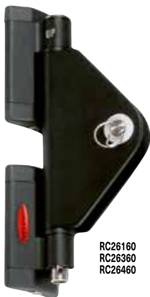
RC26160 RC26360 RC26460