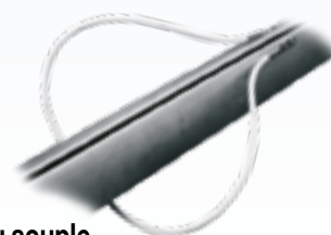
Anneau souple Pour rangement du tangon le long de la bôme