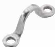
Passant pour crochet de hale-haut / hale-bas Pour tangons Ø 38 et 42 mm