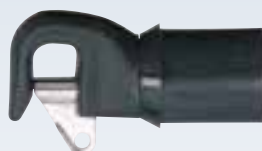
Embout de tangon Ø tube : intérieur 29 mm