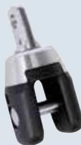
Émérillon de tête