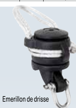
Émérillon de drisse