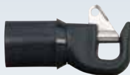
Embout de tangon Ø tube : intérieur 29 mm