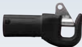
Embout de tangon Ø tube : intérieur 22 mm