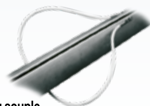
Anneau souple Pour rangement du tangon le long de la bôme