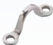
Passant pour crochet de hale-haut / hale-bas Pour tangons Ø 38 et 42 mm