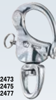
WI2473 WI2475 WI2477