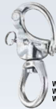
WI2373 WI2375 WI2377