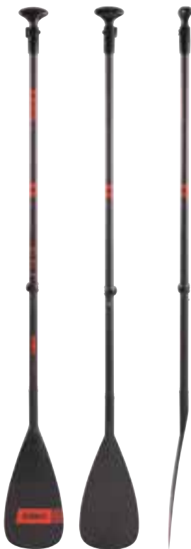
Carbon Pro Paddle 3 Pagaie, pale et poignée en 100% en carbone, télescopique en 3 parties. Longueur: 180-220 cm Poids: 680 g