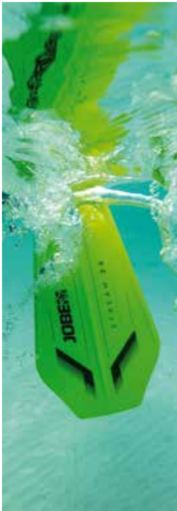
Stream 40 Carbon Paddle 3 Pagaie, pale: 40% en carbone, 60% en fibre de verre, poignée: en fibre de verre, télescopique en 3 parties. Longueur: 180-220 cm Poids: 780 g