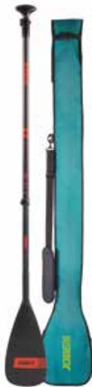
Carbon Pro Paddle 3, avec Paddle Bag Pagaie, pale et poignée 100% en carbone, télescopique en 3 parties. Longueur: 180-220 cm Poids: 680 g