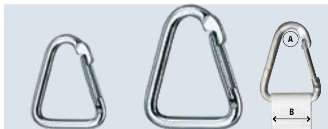
WI2345 Pour sangle largeur 40 mm