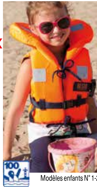
Modèles enfants N° 1-2