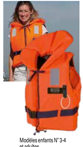
Modèles enfants N° 3-4 et adultes