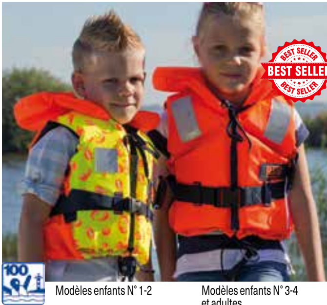
Modèles enfants N° 1-2