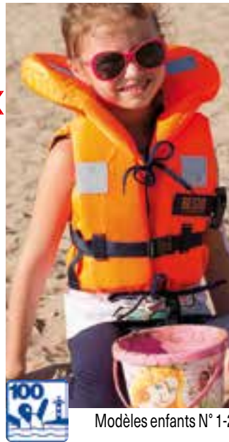
Modèles enfants N° 1-2